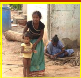
femmes du village de PMC

Les petites filles sont moins bien soignées, moins bien nourries que les garçons.