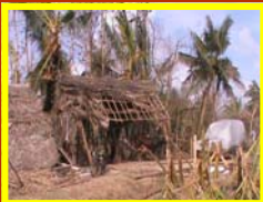
Habitat précaire détruit par Thane