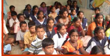
Cours du soir filles et garçons

femmes au niveau de l'éducation à la santé.